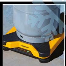
Balança de Refrigerante SRS3EC | SR47INT