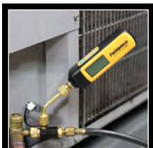
Medidor de Vácuo MG44INT