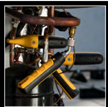
Sondas de pressão JL3PRINT