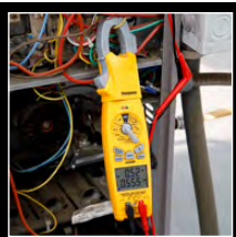
Metros de pinça SC480INT SC680INT