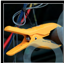
Abraçadeiras de tubos JL3PCINT JL3LCINT