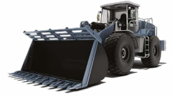
CARREGADEIRA SOBRE RODAS