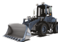
ESCAVADORAS COMPACTAS SOBRE RODAS